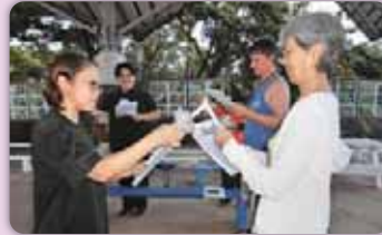
キャンドルサービス