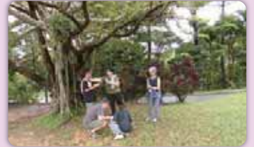
ネイチャーゲーム