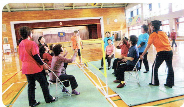
名幸講師の指導ででのひら健康バレー2分間勝負を楽しむ