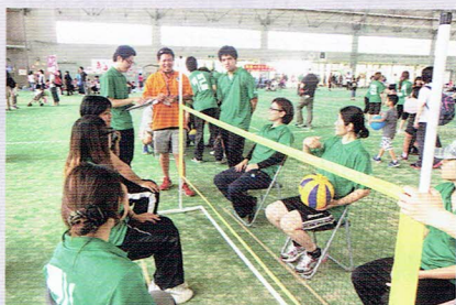
無言で真剣になり、記録に挑戦！143回出しました。楽しかったです。