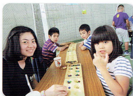
マンカラを楽しむ