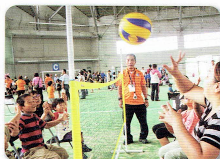
手のひら健康バレー