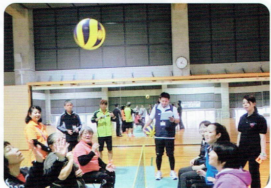
手のひら健康バレーを楽しむ