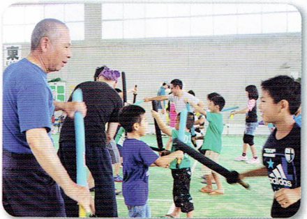
スポーツチャンバラ