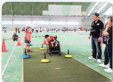
車椅子でユニカールに取り組む母子