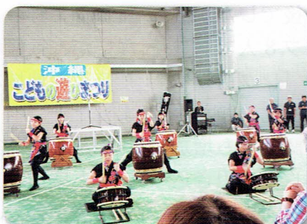
幕開けを飾る「比屋根華太鼓」