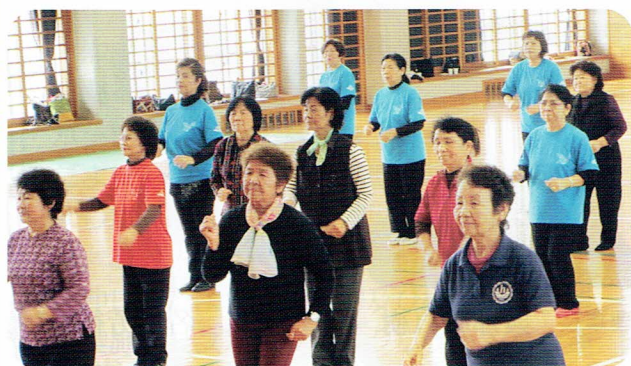
20代に戻って「ときめきのルンバ」を軽快に踊る受講生