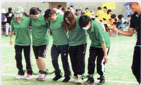
楽しかった！みんなのチームワークが良かったのでベストタイムができました。息ぴったりで！