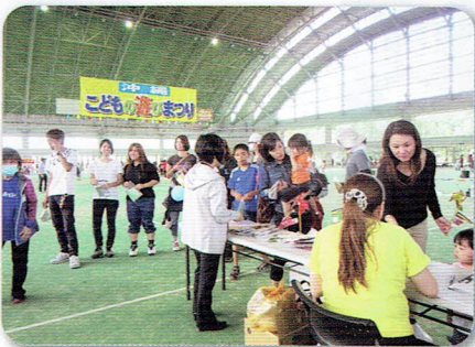
クラフトコーナーに並ぶ親子